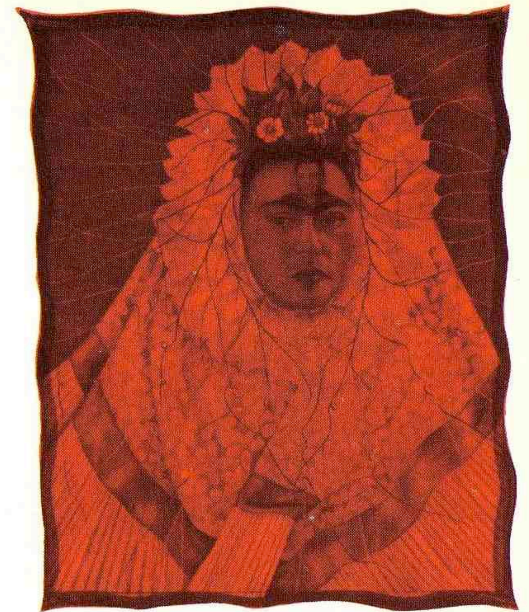
Portrait cinématographique ( la Perle )